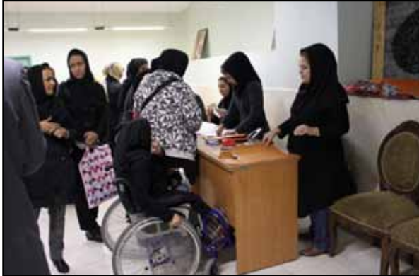
ثبت نام دانشگاه رعد