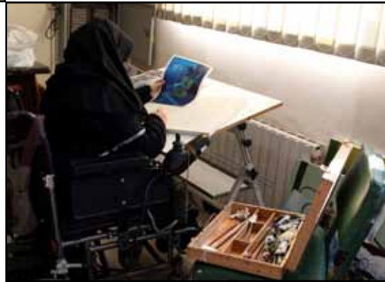
کارگاه نقاشی رعد