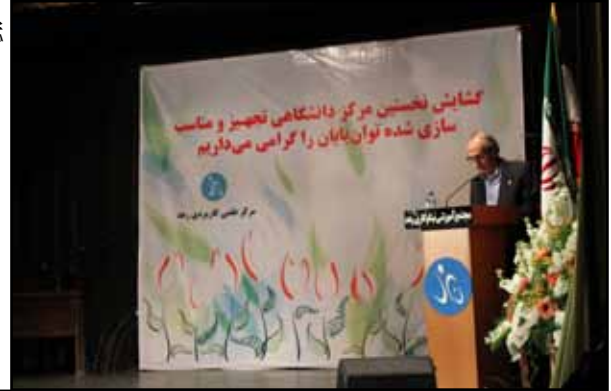
افتتاح دانشگاه رعد