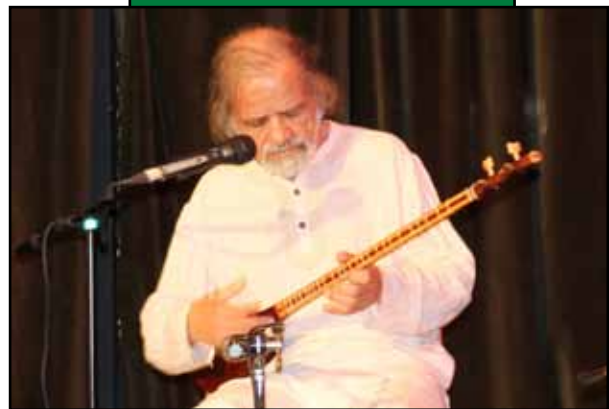
شادروان استاد جلال ذوالفنون

یادش بخیر، استاد ذوالفنون را می‌گوییم. او که در هنر موسیقی و نواختن تار و سه تار نامور و سرشناس بود. هنوز یاد و خاطره آخرین حضور هنرمندانه‌اش در مجتمع رعد را به خوبی در خاطر داریم. چه کسی فکرش را می‌کرد در عرض چند ماه به جای استاد، یادش را گرامی بداریم. در آن روز زنده یاد جلال ذوالفنون رعد را این گونه معنا و معرفی کرد.